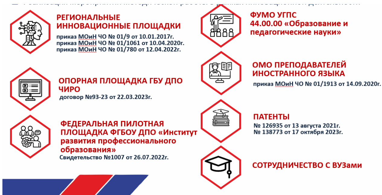
Рис.2 Направления инновационной работы в колледже

В соответствии с Критерием 2. Поддержка обновления профессиональных компетенций педагогических работников в 2023-2024 уч. году были реализованы мероприятия методической работы в рамках инновационной деятельности. Основные направления представлены на рисунке 2.